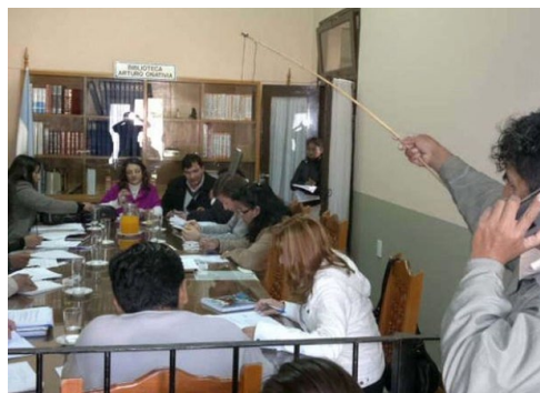
Periodista sosteniendo celular con caña de pescar tras la valla.

http://www.informatesalta.com.ar/noticia.asp?q=36652